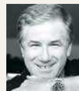
אהוד מנור ז"ל

גלי היא ילדה אופטימית, מלאת דמיון ואוהבת טבע. לקראת עלייתה לכיתה א' היא מאד מתרגשת ומשתתפת בתחושותיה את חבריה הטובים: דני השכן, הברוש, הנחיליאל ובעלי החיים בגינה. יחד איתם יוצאת גלי למסע קסום שבו היא מתמודדת עם הפרפרים שבבטן ולומדת על המשמעות של חריצות ודבקות במטרה, סבלנות ואמונה בעצמך. במחזמר משולבים שיריו המוכרים והאהובים של אהוד מנור.